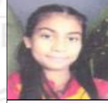
Photo and Signature